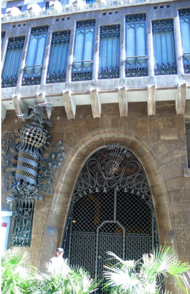
Façana del Palau Güell

tanquen que estan fets d'algun metall gris. L'entrada es enorme també amb reixes fetes de ferro forjat i ornamentat segons el que he llegit amb l'escut de Catalunya i un drac alat (que és el que més m'ha agradat i cridat l'atenció) que es obra de Joan Oñós. Encara que és una pena perquè el carrer és estret i no és pot apreciar gaire bé la façana en la seva totalitat.